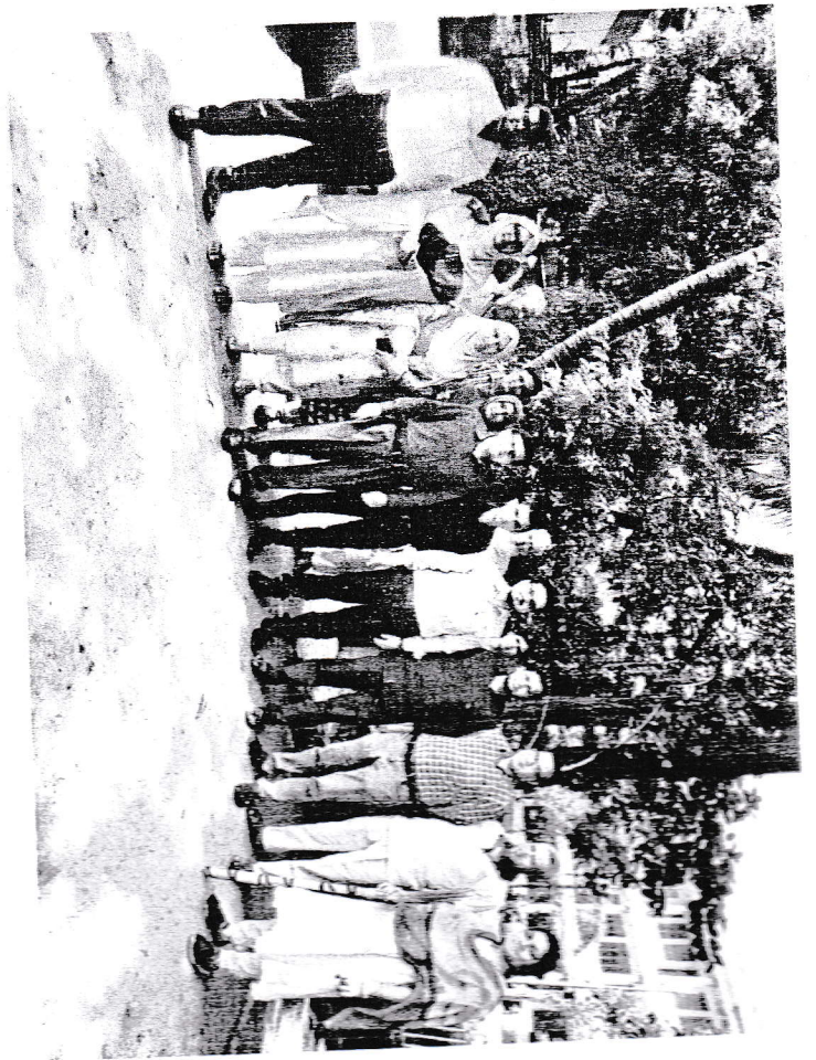
୧୨ ଜଣଙ୍କର ତା/୩୦/୨୦୧୭ ଚାରି ଫାମିଲି ସଭାରେ ଫାମିଲି ଫାଉଣ୍ଡେସନର ଉଦ୍ଦେଶ୍ୟ କାର୍ଯ୍ୟ